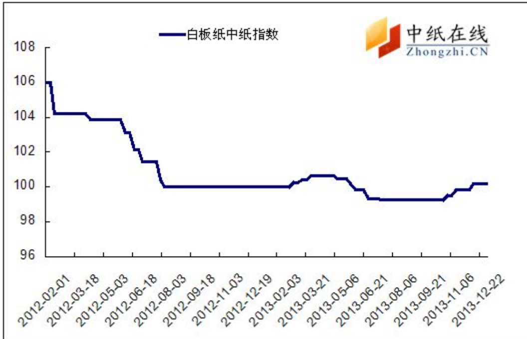
图 1：白板纸中纸指数走势图

2014年1月3日白板纸价格指数为100.16，与上周上涨了0.01，较周期内最高点106.02（2012-5-2）下降了5.86。