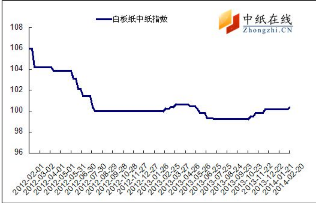
图 3: 白板纸中纸指数走势图

2014年2月21日白板纸价格指数为100.37，与上周上涨0.21，较周期内最高点106.02（2012-2-1）下降了5.65。