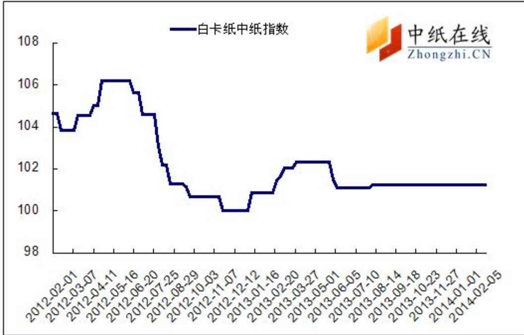
图 1：白卡纸中纸指数走势图

2014年2月21日白卡纸价格指数为101.22，与上周持平，较周期内最高点106.02（2012-5-2）下降了4.98。