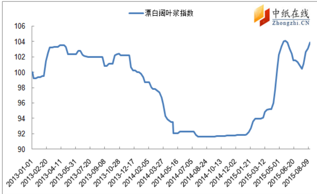
图 2: 进口漂阔浆价格指数走势图