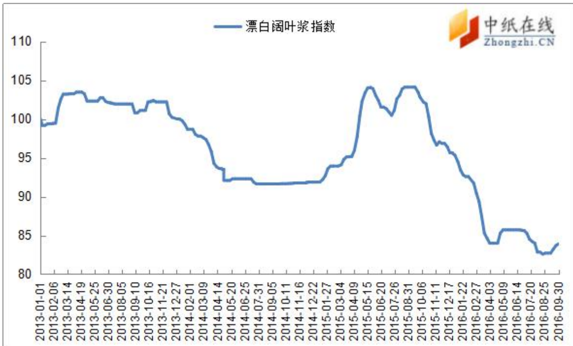
图 8：漂阔浆中纸指数走势图