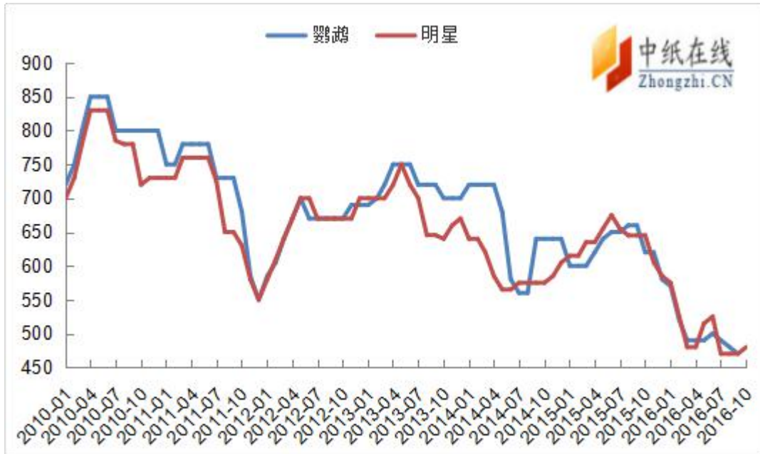
图 6: 2010 年以来阔叶浆报盘走势图 (单位: 美元/吨)