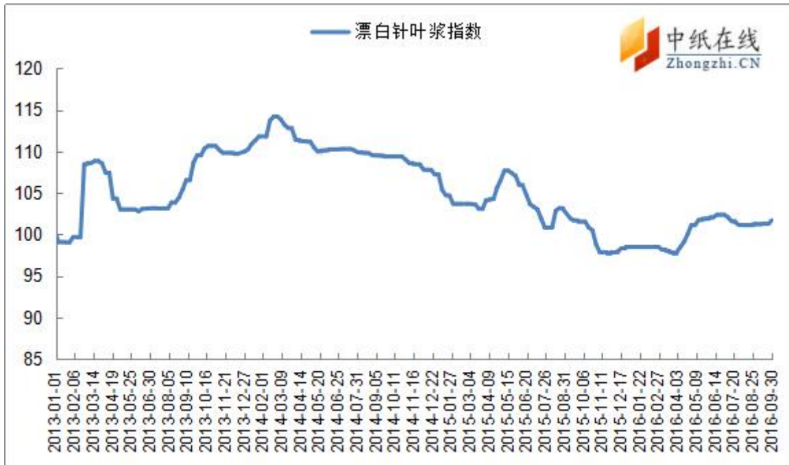
图 7：漂针浆中纸指数走势图