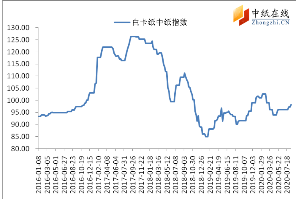
图1：白卡纸中纸指数走势图