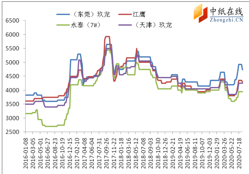
图 4: 主流品牌白板纸市场价格走势图