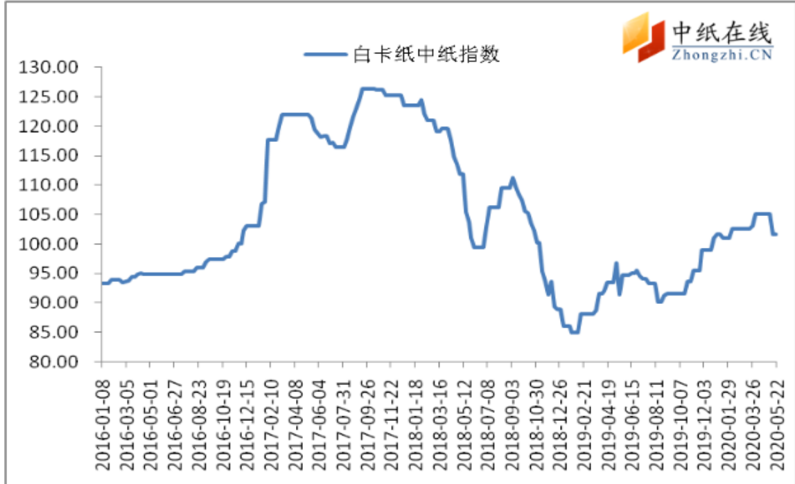
图 1：白卡纸中纸指数走势图