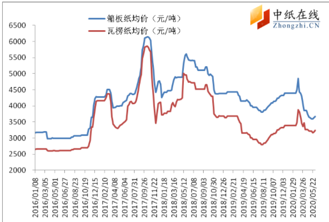
图5：箱板、瓦楞纸常规克重均价走势图