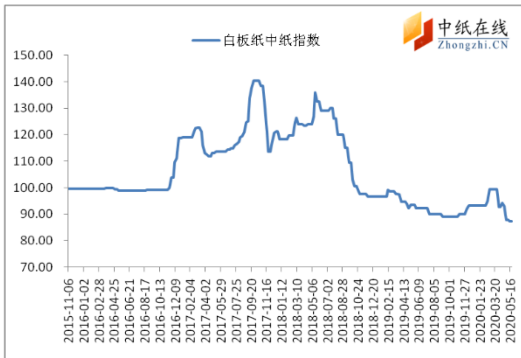
图 3：白板纸中纸指数走势图

2020 年 06 月 05 日白板纸价格指数为 92.66，与上周比增长 0。