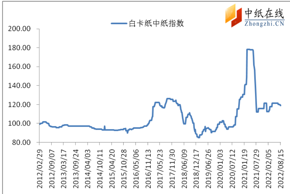
图 1：白卡纸中纸指数走势图