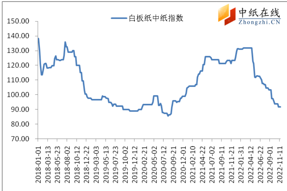
图 3：白板纸中纸指数走势图