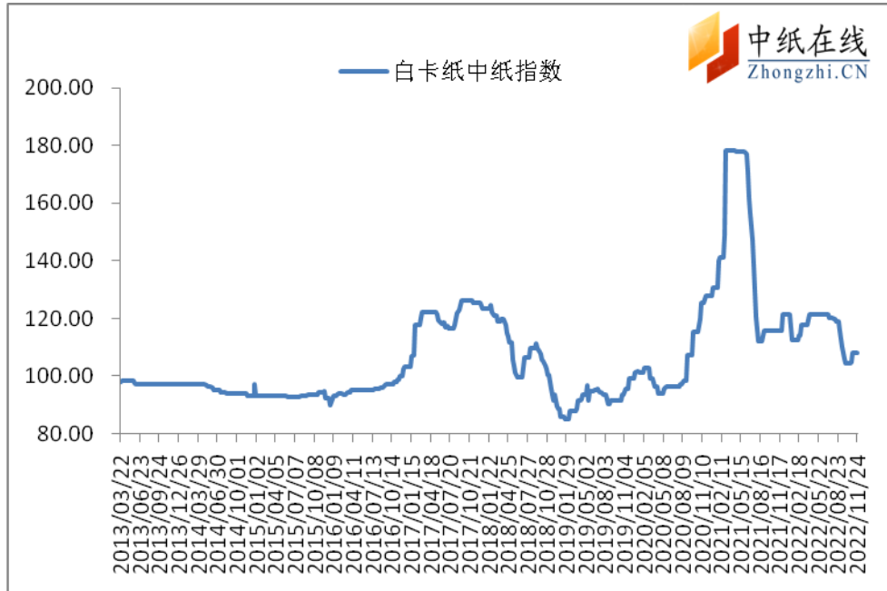
图 1：白卡纸中纸指数走势图