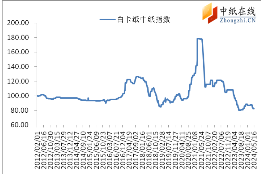
图 1：白卡纸中纸指数走势图