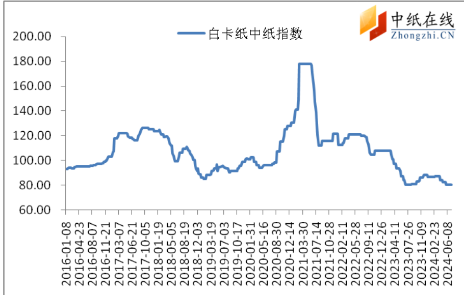
图 1：白卡纸中纸指数走势图