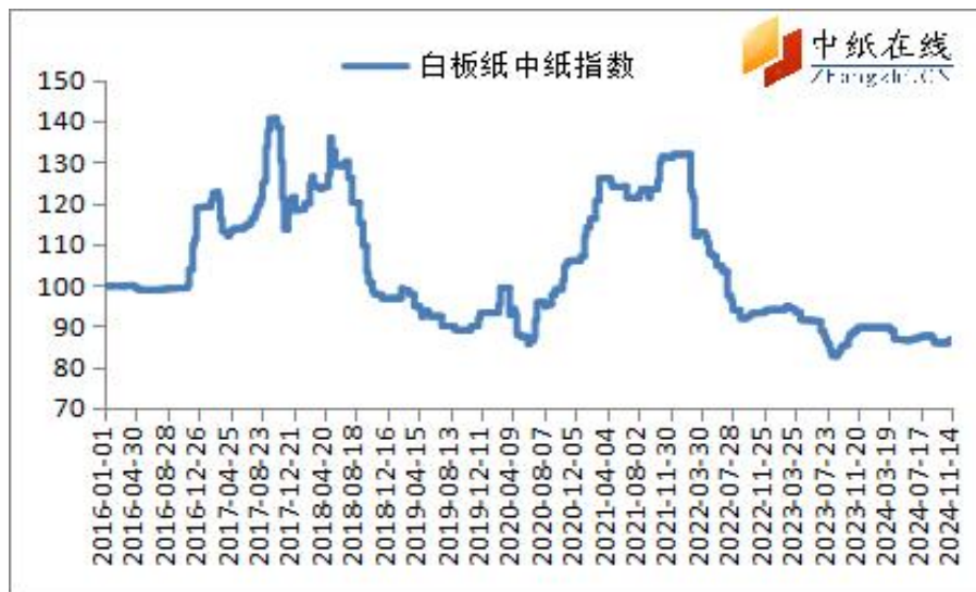
图 3：白板纸中纸指数走势图